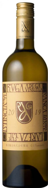
試飲過的酒和照片中所述的年份或會有差異