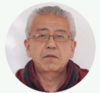
Katsunuma Winery TSUIKI Hisayoshi