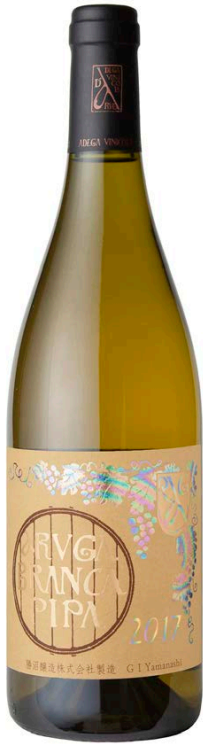
試飲過的酒和照片中所述的年份或會有差異