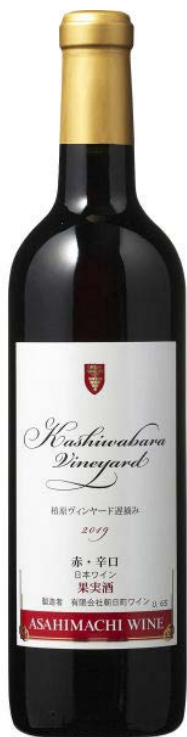
試飲過的酒和照片中所述的年份或會有差異