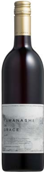
試飲過的酒和照片中所述的年份或會有差異