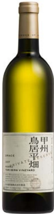
試飲過的酒和照片中所述的年份或會有差異